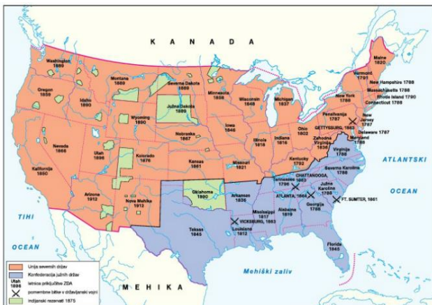
Zemljevid ZDA in državljanska vojna

Leta 1865 je bilo odpravljeno suženjstvo; 1868 so črnci dobili ameriško državljanstvo; 1870 volilno pravico; šele po 2. SV je bilo odpravljeno rasno razlikovanje.