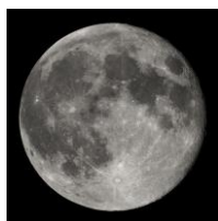
Luna – Zemljin naravni satelit