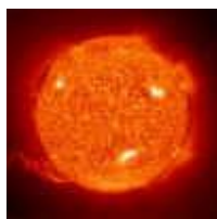
Sonce – nam najbližja zvezda

Pri izbirnem predmetu primerjamo Sonce, Luno in Zemljo. Spoznamo gibanje Zemlje okrog Sonca in si pri tem pomagamo s preprostimi modeli.